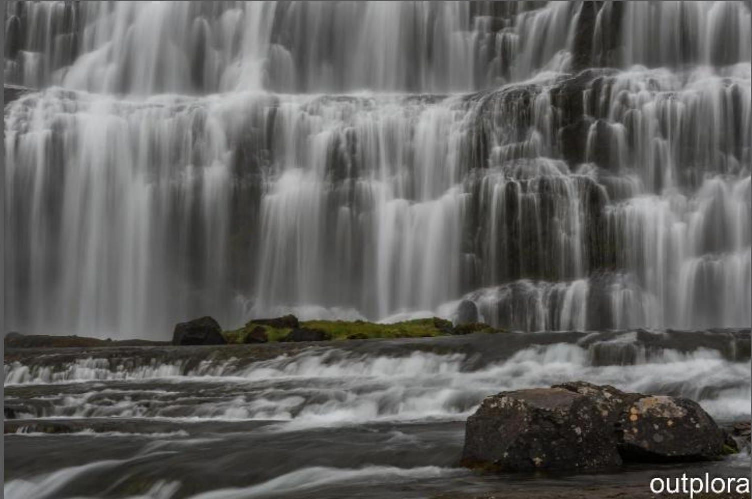
Wasserfall - Island